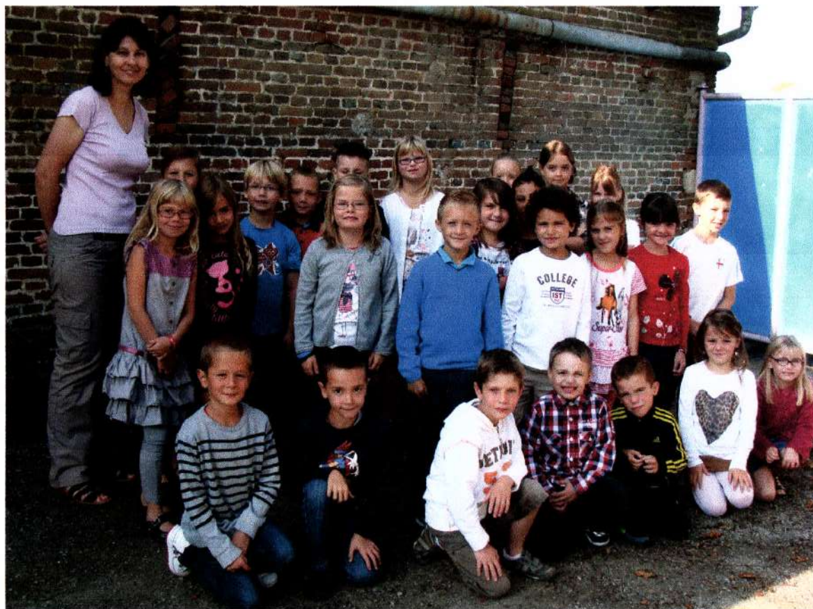
A Chivres en Laonnois